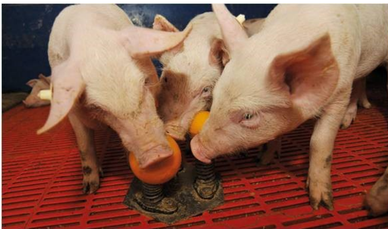
Haut : Porcs qui jouent. Droite : Quelques objets d'enrichissement utilisés dans l'étude.

« Nous avons pu obtenir des résultats intéressants sur la fréquence et la durée des interactions des