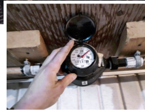
Abreuvoir et compteur d'eau.

plus pertinentes pour les producteurs. Le producteur participant a pris la décision de continuer à utiliser les bols économiseurs d'eau après l'essai puisque les résultats sont prometteurs.