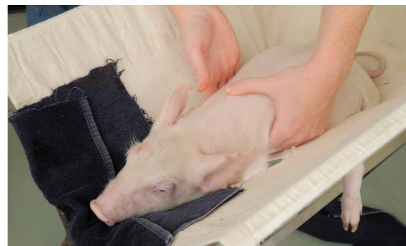
■ Détection des battements cardiaques