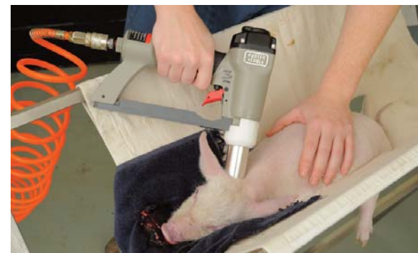
■ Décharge additionnelle derrière l'oreille