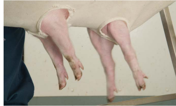
■ Spasmes toniques des pattes : rigidité