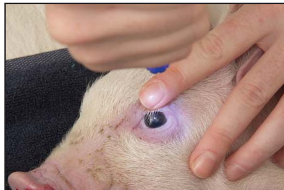
■ Exemple d'un porcelet INCONSCIENT : pas de clignement en réponse au toucher de la cornée et la pupille est fixe et dilatée.