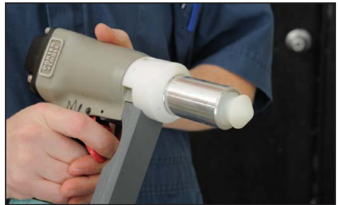
■ Le pistolet Zephyr-E en position déclenchée, exposant la tête conique de sa cheville percutante