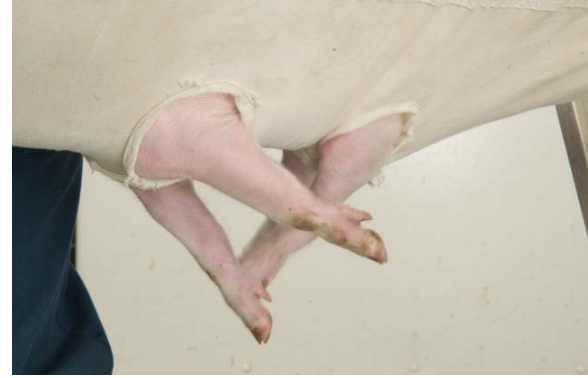
■ Spasmes cloniques des pattes : pédalage