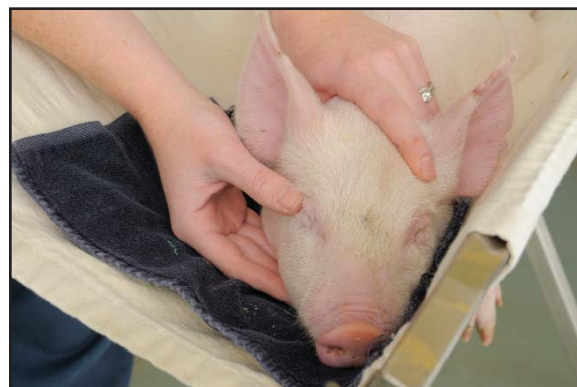
■ Exemple d'un porcelet CONSCIENT : clignement en réponse au toucher des cils.

Pour évaluer si l'animal est conscient, on peut aussi tester le tonus de la mâchoire ou la réponse au pincage du nez. La mâchoire d'un animal inconscient n'aura pas de tonus et, souvent, sa bouche sera ouverte et sa langue molle. Pour le test de réponse au pincage du nez, pincez ou piquez une zone sensible du nez. Un animal conscient remuera brusquement la tête en réponse à la douleur, tandis qu'un animal inconscient ne présentera aucune réponse.