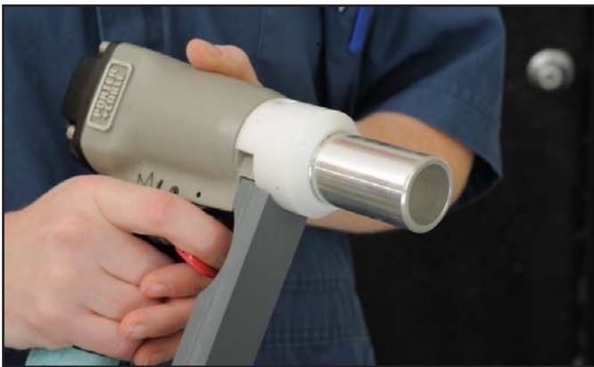
■ Le pistolet Zephyr-E en position amorcée, avec sa cheville en retrait dans le cylindre du canon

Le pistolet Zephyr a d'abord été mis au point par le ministère de l'Agriculture, de l'Alimentation et des Affaires rurales de l'Ontario (MAAARO). La version Zephyr-RS avait été créée spécialement pour étourdir les lapins dans les abattoirs. Puis, une version modifiée – le Zephyr-E – a été conçue pour l'euthanasie de différentes espèces d'animaux. Sa cheville percutante est plus longue et dotée d'une tête conique. Le Zephyr-E s'est avéré efficace pour l'euthanasie des dindes et des porcelets d'un poids allant jusqu'à 9 kg.