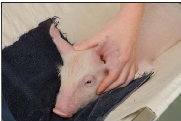
■ Test du tonus de la mâchoire

Pour évaluer si l'animal est conscient, on peut aussi tester le tonus de la mâchoire ou la réponse au pincage du nez. La mâchoire d'un animal inconscient n'aura pas de tonus et, souvent, sa bouche sera ouverte et sa langue molle. Pour le test de réponse au pincage du nez, pincez ou piquez une zone sensible du nez. Un animal conscient remuera brusquement la tête en réponse à la douleur, tandis qu'un animal inconscient ne présentera aucune réponse.