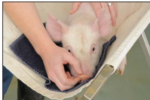
■ Test de réponse au pincage du nez